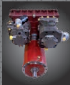
Trasmissione Power-Shift sulla gamma RE.