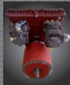
Trasmissione Power-Shift sulla gamma MAXI.