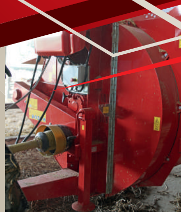
Facile apertura della turbina su tutta l'altezza.