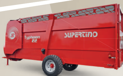
Portello posteriore con apertura a libro e con sistema di chiusura a chiavistello.