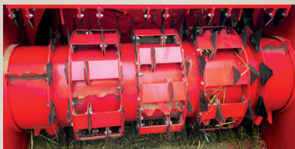
Kit 81 coltelli supplementari sui 3 rotori. (Optional).