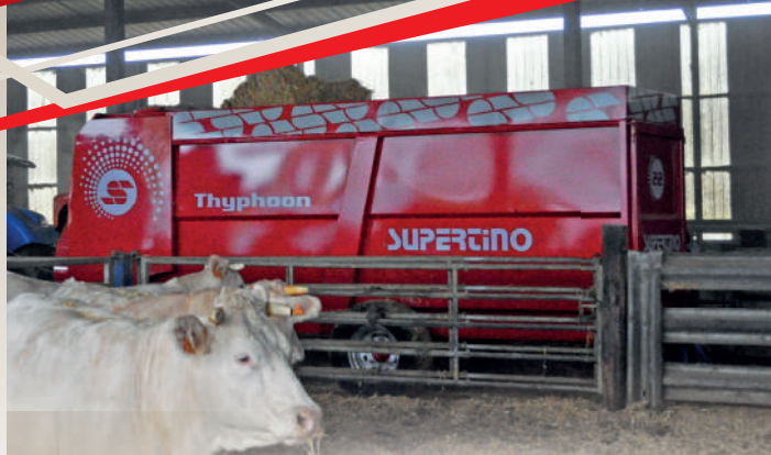
Il kit anti-polvere per l'abbattimento polvere é composto da un serbatoio da 50 lt e da 4 nebulizzatori sopra il rotore. (Optional).