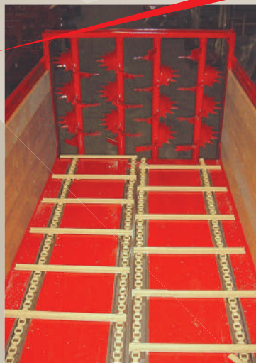
Il tappeto quattro catene 2+2 con tiraggio indipendente (optional).