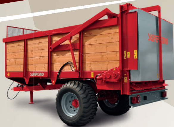
CS 95 con paratoia idraulica con apertura simultanea della protezione coclee.