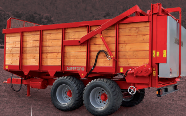
CS 140 S