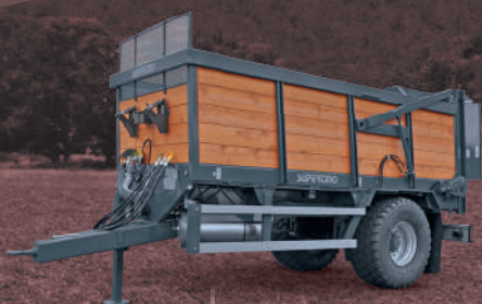
CS 100 MR