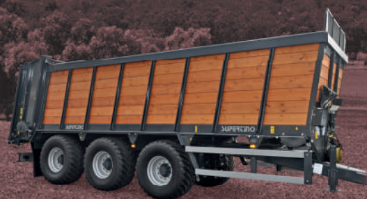
CS 300 MR