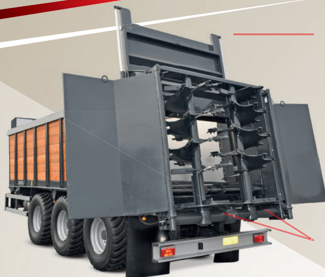
Paratoia a ghigliottina con binari e paratie laterali idrauliche indipendenti. (Optional).