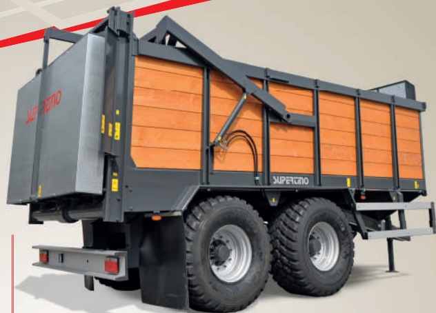
La paratoia idraulica per liquami (optional) permette il carico di fanghi, prodotti semi-liquidi, etc.