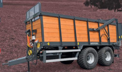
CS 180 MR