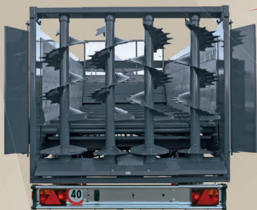
Spanditore a 4 rulli verticali.